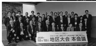
10月18日(日) 地区大会(岡山)