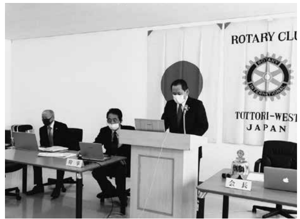
4月24日(金) オンライン例会