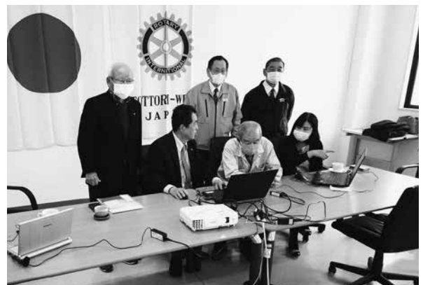
4月22日(水) Zoom 研修会