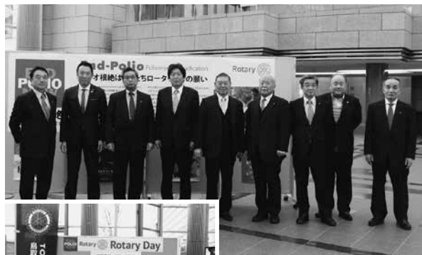
2月5日(水) ロータリーデー