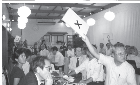
地区補助金プロジェクト(8/30 若桜駅にて)